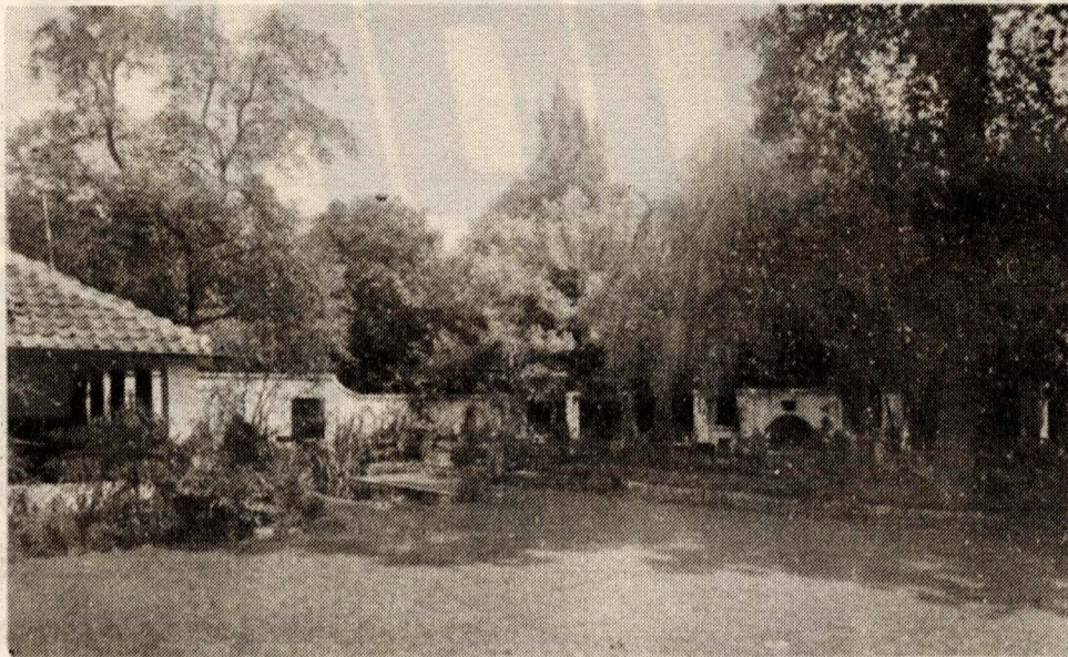
(1) De tuin van restaurant De Beukenhof. Deze foto is helaas niet gedateerd maar lijkt van voor Wereldoorlog II.

In deze rubriek worden oude foto's uit Oegstgeest onder de loep genomen. Hoe was het toen? Welke Oegstgeesten leefden in die tijd? Hoe is het nu? Wat is er veranderd? Wie leven en werken er nu op deze plek? Deze week kijken we naar De Beukenhof. De foto's zijn afkomstig van de Vereniging Oud Oegstgeest.