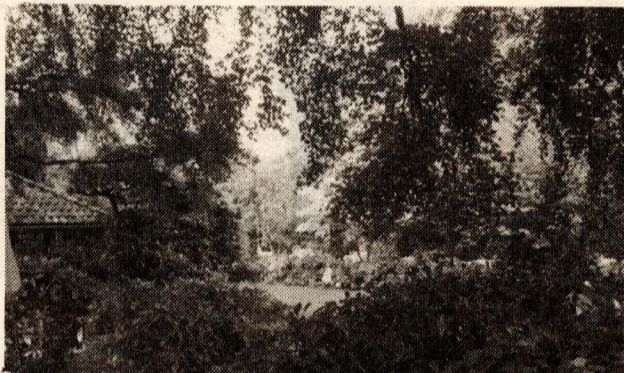
(2) De tuin ziet er vandaag de dag heel anders uit. Zozeer zelfs dat het erg moeilijk was te bepalen waar de foto genomen was. De beplanting is in het midden enorm uitgebreid, waardoor de gasten zich in een park wanen en veel privacy hebben; de stenen pergola is dichtgebouwd en begroeid met klimplanten.

schenkerij. Het etablissement krijgt een nieuwe naam: vanwege de drie eeuwen oude beuk in het midden van de tuin gaat het Beukenhof heten. In 1948 krijgt het zijn huidige uiterlijk en gaat door het leven als restaurant De Beukenhof. Het is sindsdien een begrip geworden.