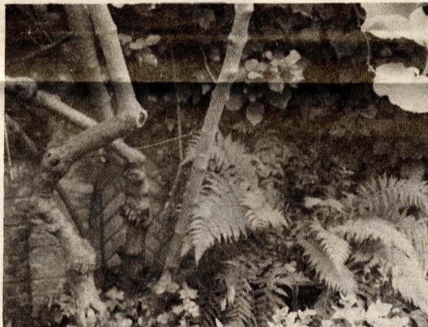
(3) Het ronde poortje in de pergola dat op de oude foto (1) zichtbaar is, valt nauwelijks meer te traceren en de bezoeker moet er pal voor gaan staan om het te kunnen zien.